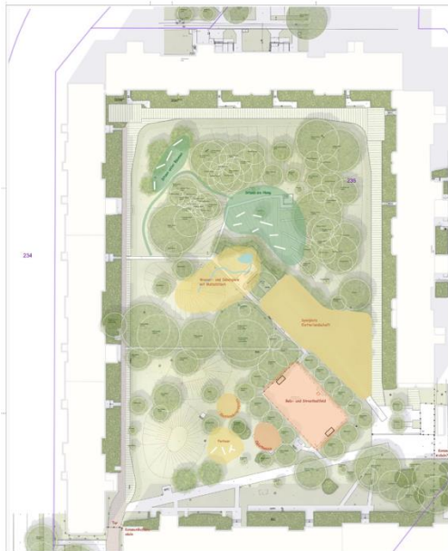
Vorentwurf Variante A