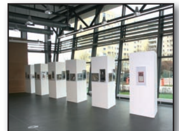
Hier könnte auch Ihr Foto ausgestellt werden!