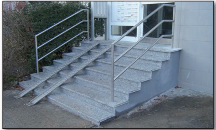
Neugestaltete Treppenstufen im Eingangsbereich Ahrenshooper Str. 64

Rüdiger Scheel Abt.-Itr. Technik/Bewirtschaftung