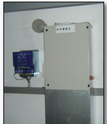
E-Verteilung für Aufzüge