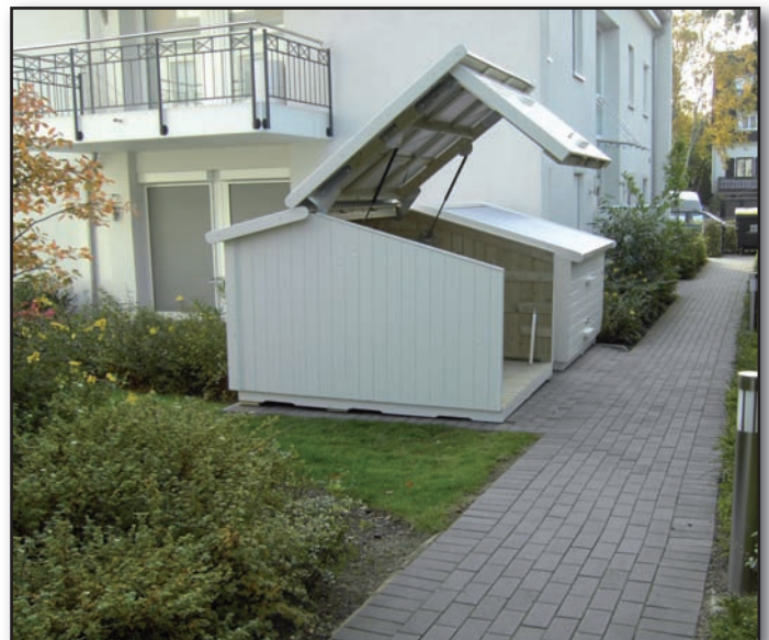
Beispiel einer Zweiradgarage weiß lasiert mit Metallabdeckung

Rüdiger Scheel Abt.-lfr. Technik/Bewirtschaftung