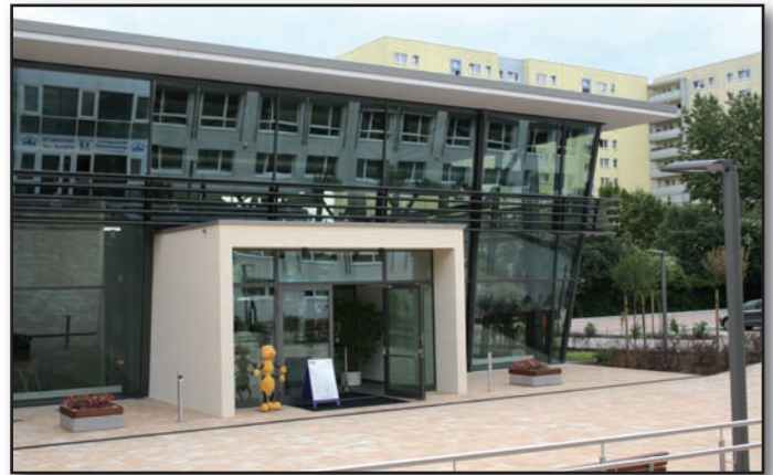
Blick auf das Veranstaltungsgebäude