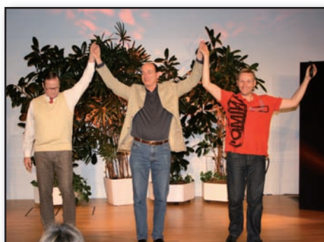
Die Comedians vom Quatsch Comedy Club sorgten für prächtige Stimmung